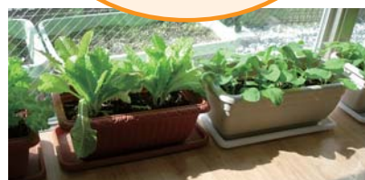
デイサービスで育てている野菜です！